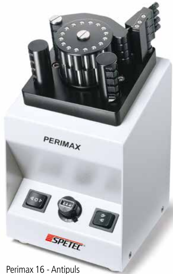
Perimax 16 - Antipuls

Die Perimax Peristaltische Pumpe findet ihre Anwendung in allen Bereichen der analytischen und präparativen Chemie sowie im Produktionsbereich: